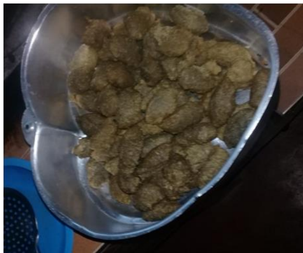
Figura 1. Foto da receita pronta.

Lembro-me de meu tempo de criança. As coisas eram muito difíceis, quase não tínhamos o que comer. Minha mãe inventou esses bolinhos. Banana lá em casa tinha muita. Também tinha galinha. Então era fácil conseguir os ingredientes. Eu e meus irmãos gostávamos muito desses bolinhos. Eu sempre faço essa receita, é uma forma de lembrar dos velhos tempos em que tinha minha mãezinha.