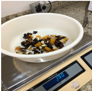
Figura 1: Frutas secas e castanhas utilizadas nas barrinhas.

secos, observou-se a barrinha de cereal controle feita com o xarope de aglutinação, e colocou-se 250 gramas de mel industrializado para aproximação da textura onde ao misturar os ingredientes homogeneizou-se o mel juntamente com a preparação que havia os componentes secos. Após o procedimento, foi acrescentada a mistura em uma forma com papel filme sobre os ingredientes, sendo pressionada com força mecânica utilizando a assistência de outra forma, para que as barrinhas ficassem uniformes e firmes. Logo após, foi colocada em refrigeração, para que tornasse ainda mais rígida para o consumo, assim no término da preparação foi realizada uma análise sensorial piloto com 23 alunos que estavam presentes laboratório de tecnologia de alimentos.