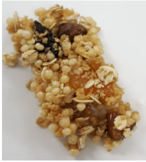
Figura 3: Barrinha de cereal com mel.