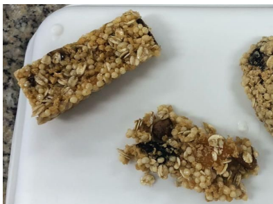
Figura 4: Barrinha controle (esquerda) e barrinha com mel (direita).