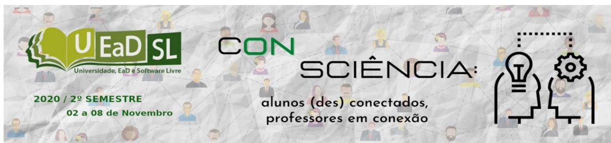
Figura 1. Ensino Remoto Emergencial – desafios dos professores